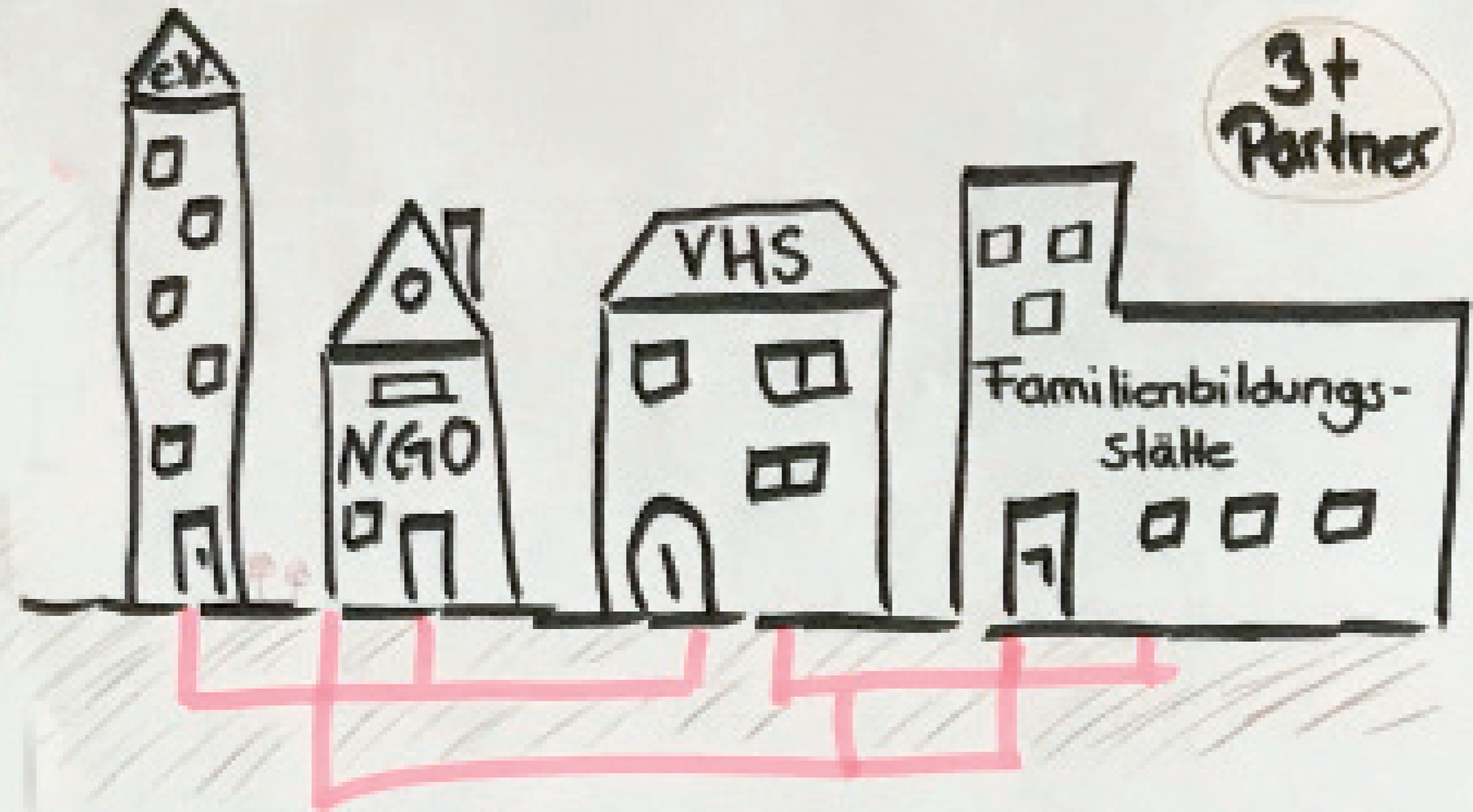
öffentliche & private Einrichtungen